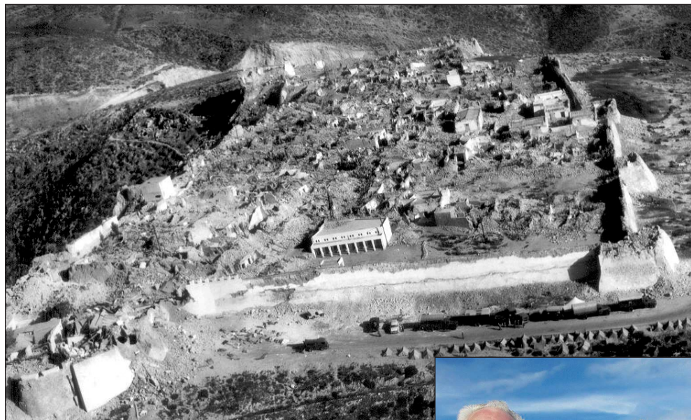
Links: luchtfoto van verwoest Agadir in februari 1960. Onder: Arie van den Berg (links), Pier de Jong (midden) en Joop Romkema terug in Agadir, waar ze vijftig jaar geleden als jonge broekjes lijken ruimen.

„s Avonds, als we terug aan boord gingen, marcheerden we langs rijen opgestapelde lijken, die zo'n vijftien meter breed, wel drie of vier kilometer lang langs het strand lagen. Eenmaal terug aan boord, moesten we ons aan dek helemaal poedelnaakt uitkleeden, en door een badje met lysol lopen. Vervolgens werden we met de brandslang afgespoten. Onze kleding ging in de was, schoenen werden gereinigd, uit angst voor besmettingen en ernstige